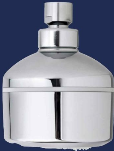
T-Safe Emergency hodedusj