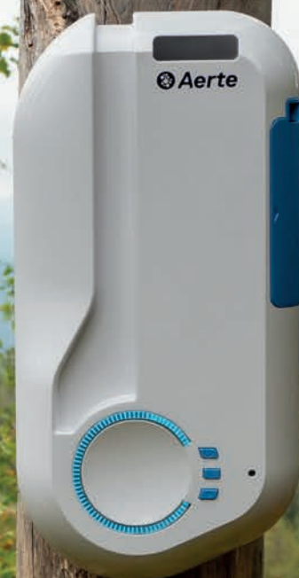
Aerte AD 2.0